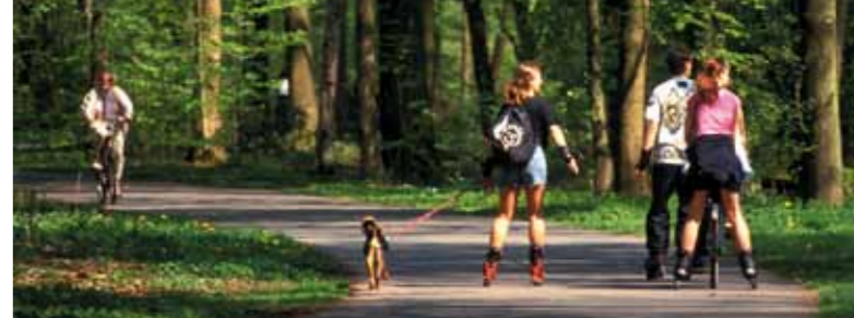
Skaten und Radfahren in der Eilenriede