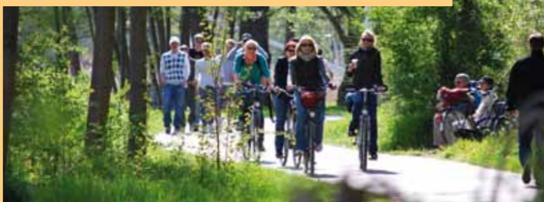
Radeln rund ums Steinhuder Meer