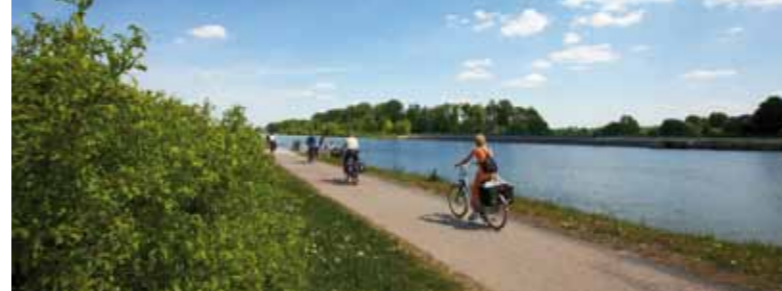
Auf Entdeckungstour entlang des Mittellandkanals