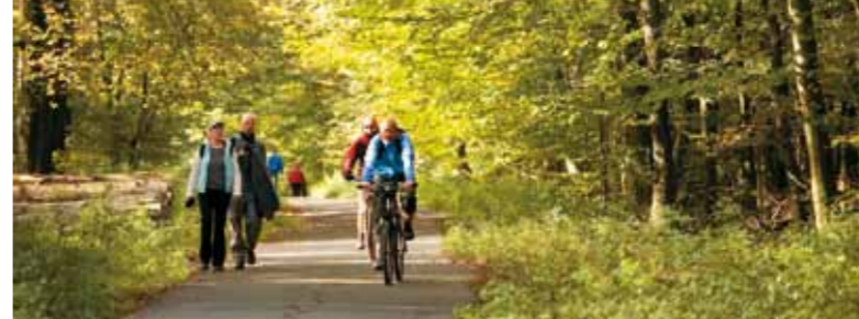
Den Deister per Rad erkunden