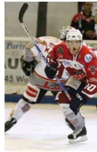
EC Hannover Indians

Der unter Denkmalschutz stehende mittelalterliche Pferdeturm war Teil der ehemaligen Landwehr der Stadt Hannover und wurde erstmals 1387 urkundlich erwähnt. Er steht direkt vor dem Eingangsbereich des Eisstadions, das 1959 gebaut und 1978 überdacht wurde. Neben dem öffentlichen Eislaufbetrieb trainieren und spielen hier regelmäßig die Hannover Indians des EC Hannover. Die ev.-luth. Petrikirche ist bereits vom Braunschweiger Platz aus weithin sichtbar als „Tor“ zum Stadtteil Kleefeld. Sie wurde im Zweiten Weltkrieg zerstört und erst 1953 wieder aufgebaut.