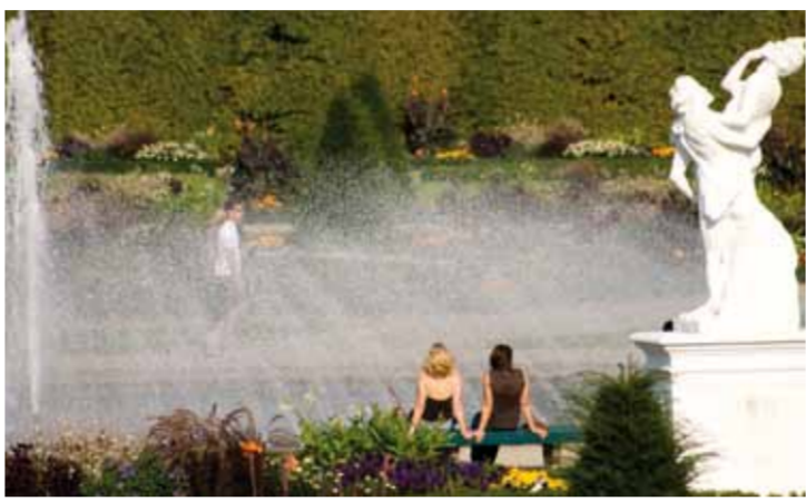
Entspannte Pause im Großen Garten

Der Sportpark Hannover bietet viel Bewegung: Bundesligaspiele und Open-Air-Konzerte der Spitzenklasse in der AWD-Arena. Auf der angrenzenden Mehrkampfanlage trainieren die Profis von Hannover 96 und es gibt z.B. Leichtathletik-Wettkämpfe. Im Bundesleistungszentrum Nord wird der sportliche Nachwuchs gefördert. Das Stadionbad lädt zum Baden und Saunen ein. Konzerte und Comedy finden in der AWD-hall ganzjährig statt. Die Gilde Parkbühne bietet „open air“ Musik, Kino und Feste im Sommer.