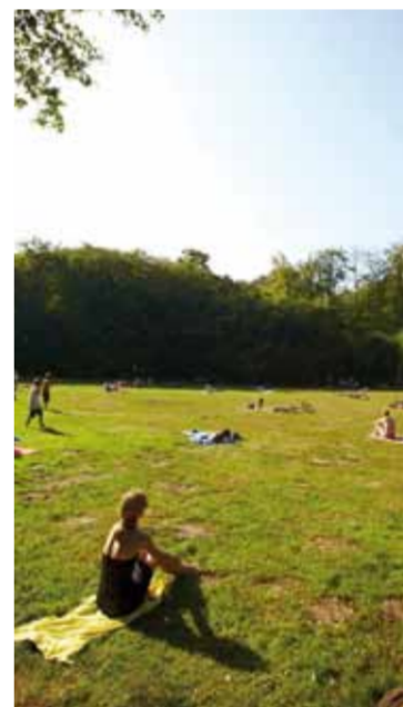
Entspannung mitten im Wald