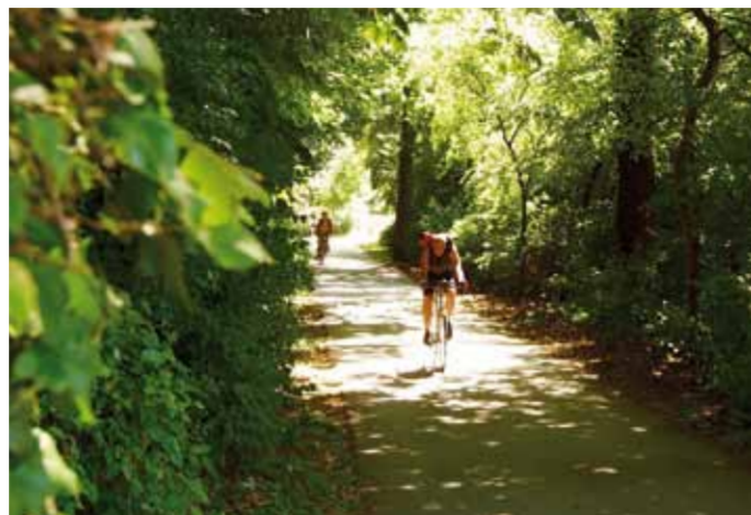
Radeln in der Eilenriede