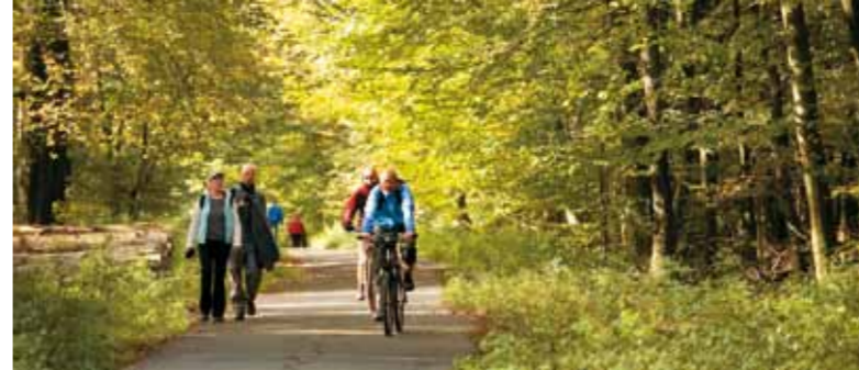
Den Deister per Rad erkunden