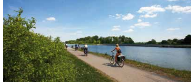
Auf Entdeckungstour entlang des Mittellandkanals