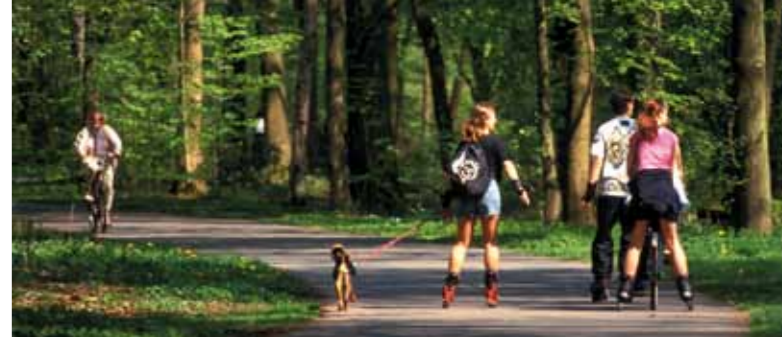
Skaten und Radfahren in der Eilenriede