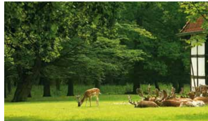
Wild im Tiergarten

Der hannoverschen Brauergilde waren die Anderter ein Dorn im Auge: Mit ihrem 1727 gegründeten Brauhaus machten sie dem Broyhan Konkurrenz. Ab 1818 bis zur Einstellung der Bierproduktion 1955 Besitz der Familie Scheele. Das Wappen am ehemaligen Verwaltungsgebäude Krümme Straße, Ecke Am Tiergarten erinnert an die Anderter Brautradition.