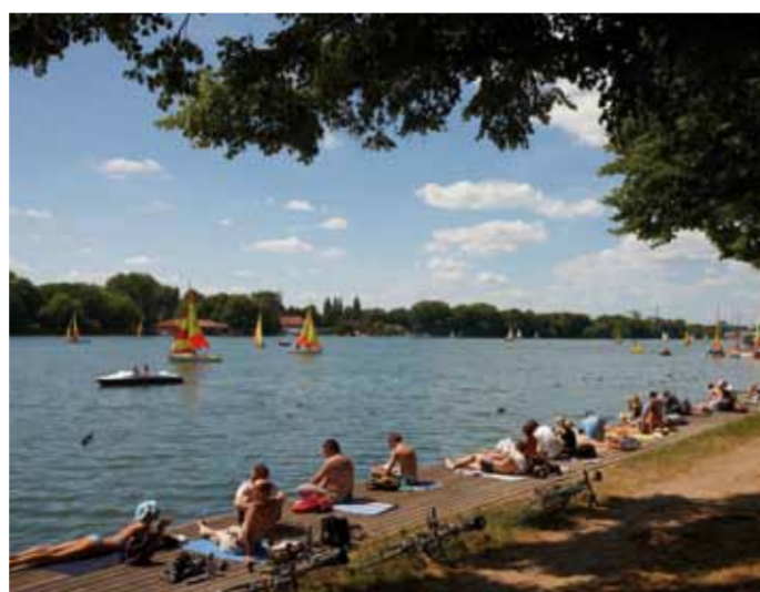
Am Ufer des Maschsees

Bitte verhalten Sie sich rücksichtsvoll gegenüber Fußgängern. Danke.