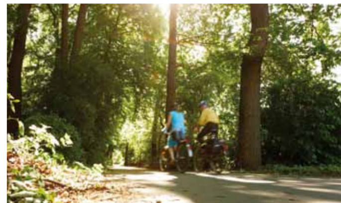
Radfahrergnügen in der Eilenriede

Herzog Johann Friedrich ließ den Tiergarten 1678/79 für Hofjagden anlegen. Nach 1866 in preußischer Verwaltung. 1903 erwarb die Stadt das 112 Hektar große Areal mit schönem altem Baumbestand. Heute leben in dem 112 Hektar großen Wildpark Damhirsche, Wildschweine und Rehe. Eintritt frei.